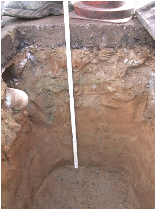
Sondage: Ein paar Steine eingebettet in Lehm unter ca. 10 cm Belag, darunter gelber Lehm. Der Grund für den schlechten Zustand ist offensichtlich in der ungenügenden Tragfähigkeit des Strassenaufbaus zu suchen. Deshalb ist nicht nur der Belag, sondern auch die Foundationsschicht zu ersetzen.

Die Bilder zeigen, dass eine Sanierung, insbesondere mit Blick auf die Verkehrssicherheit, dringend notwendig ist.