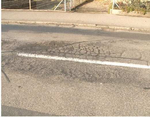
Netzrisse mit Schlagloch