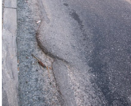
Spurrinnen mit Beschädigungen (plastische Verquetschung) des Belages durch den Schwerverkehr